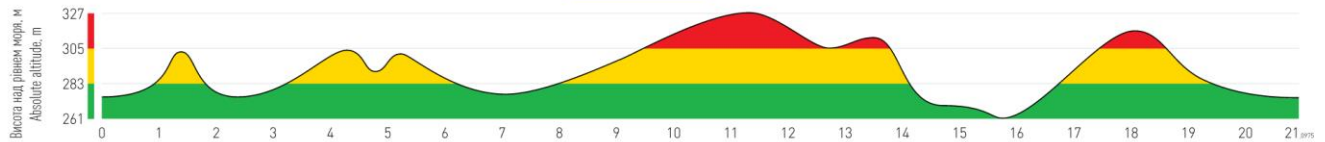
Маршрут естафети 1x10+1x11.0975 км