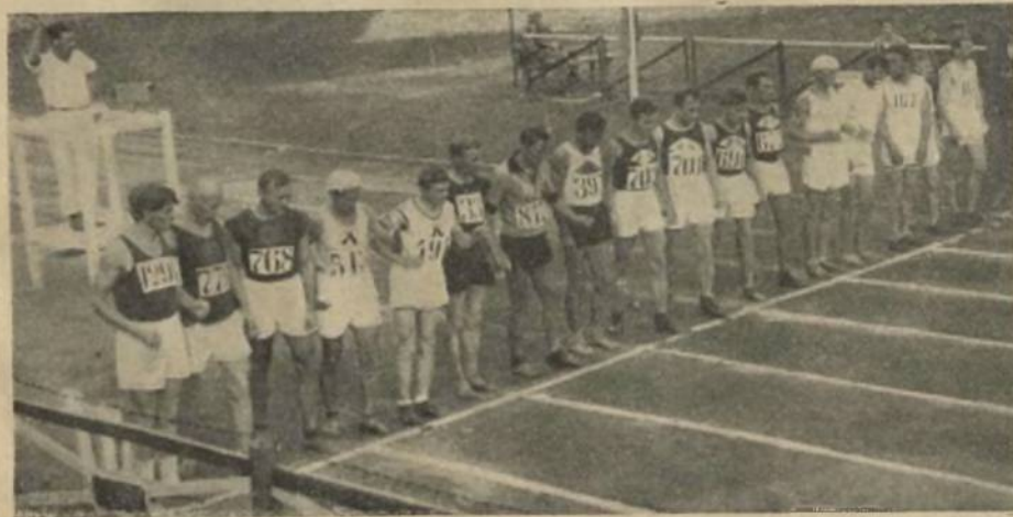
Старт участникам ходьбы на Спартакиаде