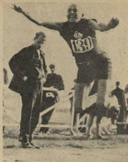
Парфенович (Сев. Кавказ)

Финальный бег на 800 м. прошел в интересной борьбе между ленинградками Ильи-