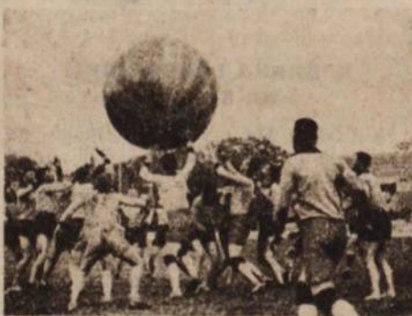
Игра в волейбол между командами оборонного цеха и оборонной командой завода № 1

В составе коллектива: рабочих — 43, служащих — 19, инженеров — 4, учащихся — 6, врач — 1, женщин — 14, членов ВКП(б) — 16, членов ВЛКСМ — 9, ударников — 32.