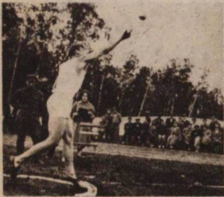
Безрука (Украина) толкает ядро