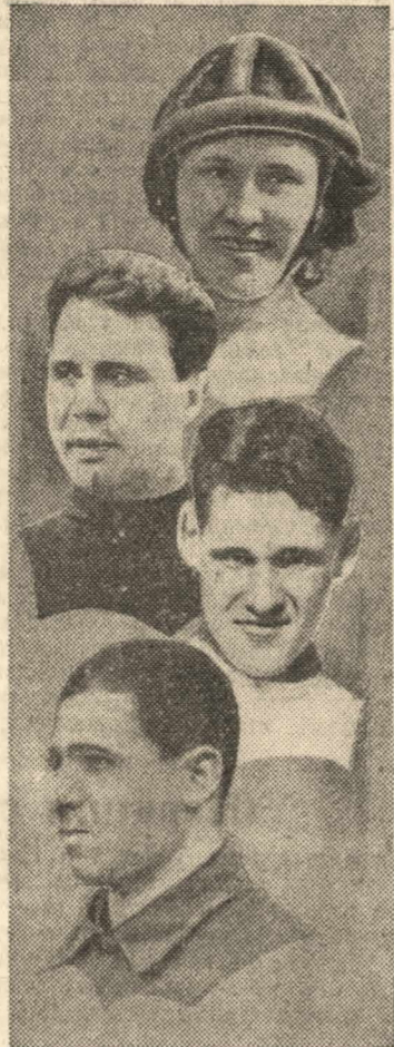
Северная гонка УСПЕХ ЯХТСМЕНОВ АРХАНГЕЛЬСКА

Большую роль в подготовке общественного актива предстоит сыграть физкультурным учебным заведениям. Они должны стать центрами очной и заочной подготовки общественных работников. В большинстве добровольных спортивных обществ до сих пор подготовка общественного актива не уделялась должного внимания. Во многих обществах средства, отпущенные на эту работу, оказались неиспользуемыми. Отдел физкультуры и спорта ВЦСПС фактически не руководит и не контролировал ход подготовки кадров общественных работников. И в результате такое общество, как, например, «Медик», вместо 2,238 физиков подготовило всего лишь 285, вместо 617 инструкторов-общественников — 99. В обществе же «Наука» не существовало даже и плана этой работы. Общественный актив нуждается также и в повседневной серьезной методической помощи. Нужно хорошо наладить, консультацию, повсеместно организовать методические кабинеты, чтобы общественники в любой момент могли получить необходимый совет, указание, познаться с литературой, с опытом передовых коллективов. Могучей порывисто поднимаются сейчас новые слои физкультурного актива. Новой силой пополняется физкультурное движение. Если мы будем работать с этим активом по-настоящему широко и смело развлекать самостоятельность, тогда новые успехи, новые достижения физкультурного движения обеспечены.