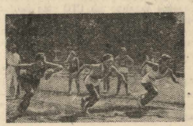
На спартакиаде медвузов Украины в Киеве. На снимке: старт женского забега на 100 м.