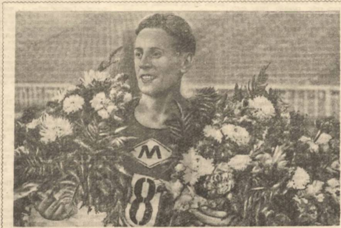
С. КУЗНЕЦОВ — чемпион и рекордсмен СССР по десятиборью и прыжкам в длину.