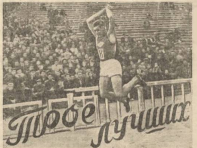
Технические результаты первенства СССР по легкой атлетике

Примечание: И — количество игр, З — количество выигранных, Н — количество ничьих, П — количество поражений, М — соотношение мячей, О — количество очков.