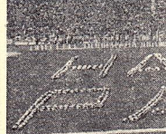
Массовые выступления спортсменок на стадионе имени Хрущева.