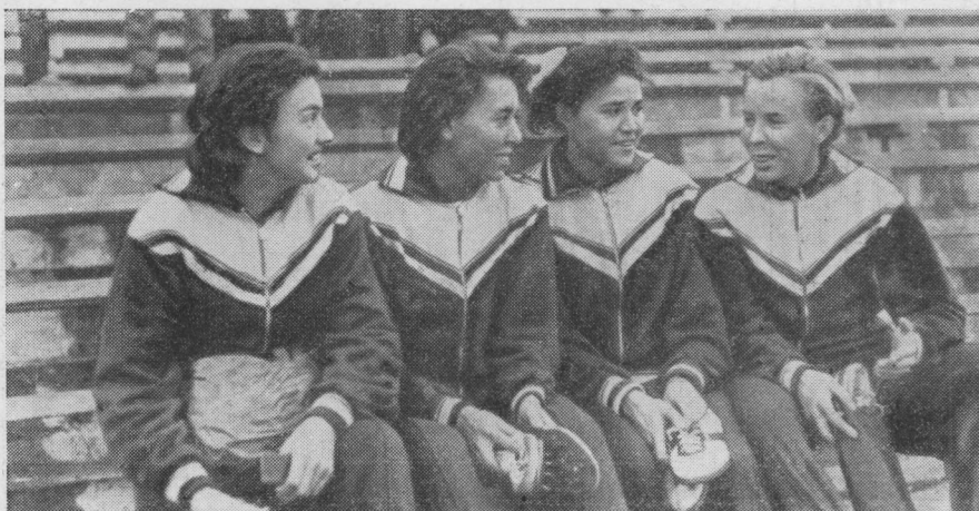
Команда РСФСР — победительница в эстафете 4×200 м