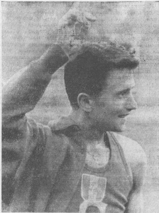
А это Мишель Жази

месте, позволил сбить темп своего бега. А ему следовало бы усилить темп, дотянуть до поворота и там заставить соперника выйти на вторую дорожку. Возможно, именно это могло решить судьбу приза.