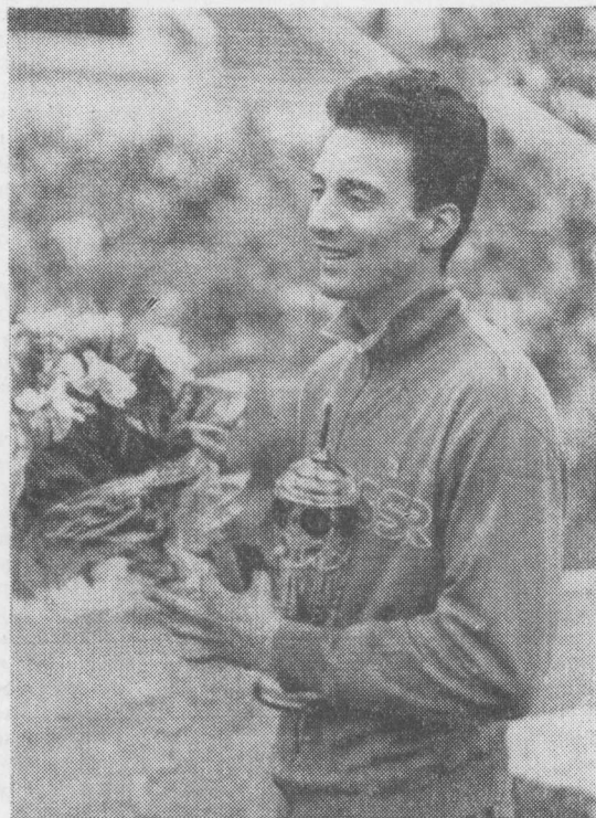
Победитель в беге на 1500 м Т. Салингер

Надо отдать должное не только мастерству и физической подготовленности французского спортсмена, но и его бойцовским качествам: он буквально вырвал победу у Иванова на последних метрах дистанции. Вообще-то в данном случае у Боже было некоторое преимущество: небольшой вес облегчал ему бег по мокрой дорожке. На заключительном круге Иванов допустил обидный просчет. Во время спурта Боже на противоположной от финиша прямой наш стайер сразу уступил бровку французам, из-за чего даже потоптался на