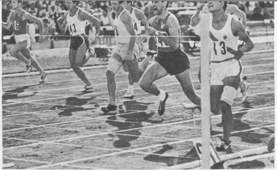
Забег на 100 м. Впереди японский спортсмен Х. Иидзима.