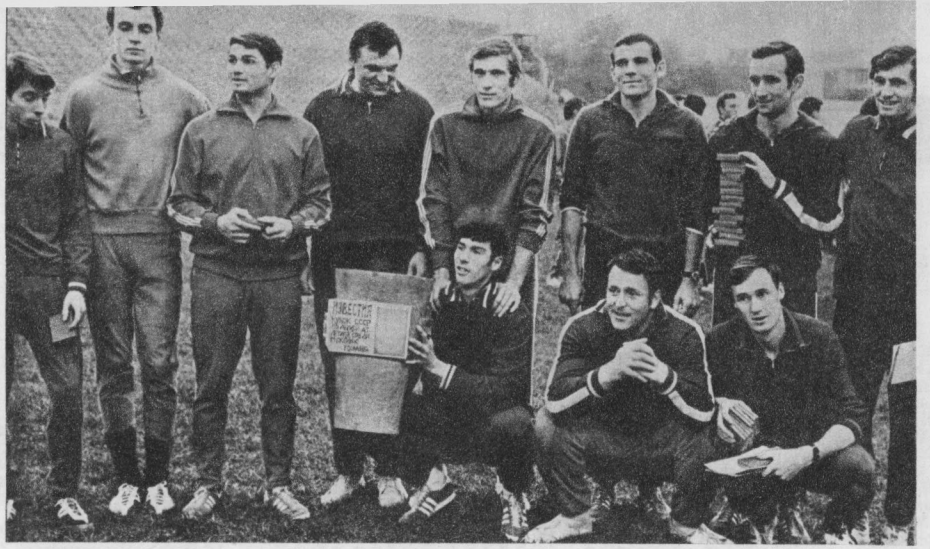
Команда Москвы — победительница соревнований на кубок «Известий»

Наконец, стадион и судьи. Эти состязания «заиграют» только тогда, когда стадион будет уподоблен гигантской сцене, а спортсмены и судьи — актерам, среди которых нет статистов. Каждый ведет свою, индивидуальную