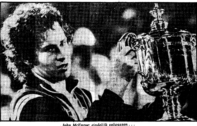
John McEnroe: eindelijk volwassen...

8-6 in de vijfde set van Borg) benaderde, dat inmiddels de hoop wel hebben opgegeven ooit nog een echt belangrijk toernooi te kunnen winnen. Want waren Borg en Connors voor hem altijd al onoverwinnelijke tegenstanders, McEnroe heeft zich nu bij dit selecte gezelschap gevoegd.