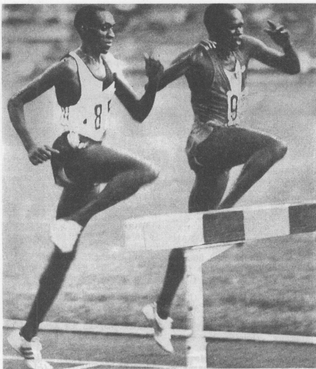
Олимпийский чемпион Джулиус Кариуки и рекордсмен мира Петер Коэч

От Ямайки до Москвы оказывается не так уж далеко, если бежать так же быстро, как Джулия Катберт!