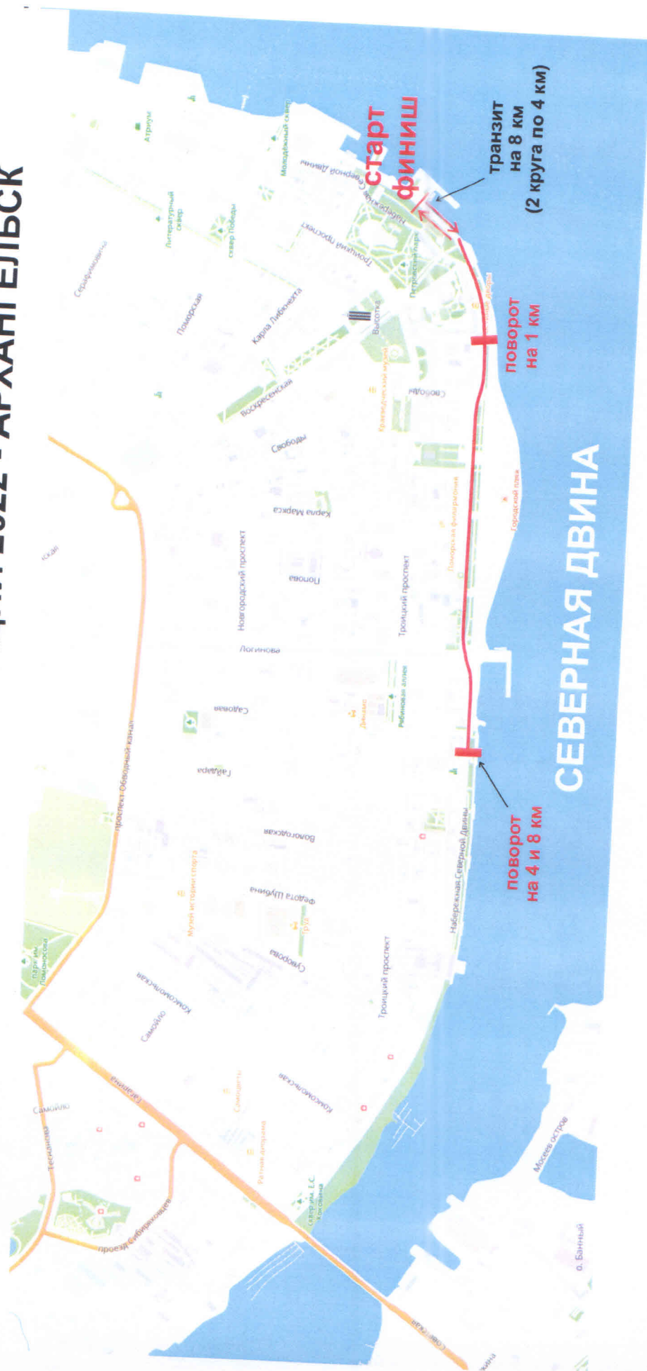
СХЕМА ТРАССЫ КРОСС НАЦИИ 2022 - АРХАНГЕЛЬСК

Маршрут проведения центрального старта Всероссийского дня бега «Кросс нации – 2022» в Архангельской области