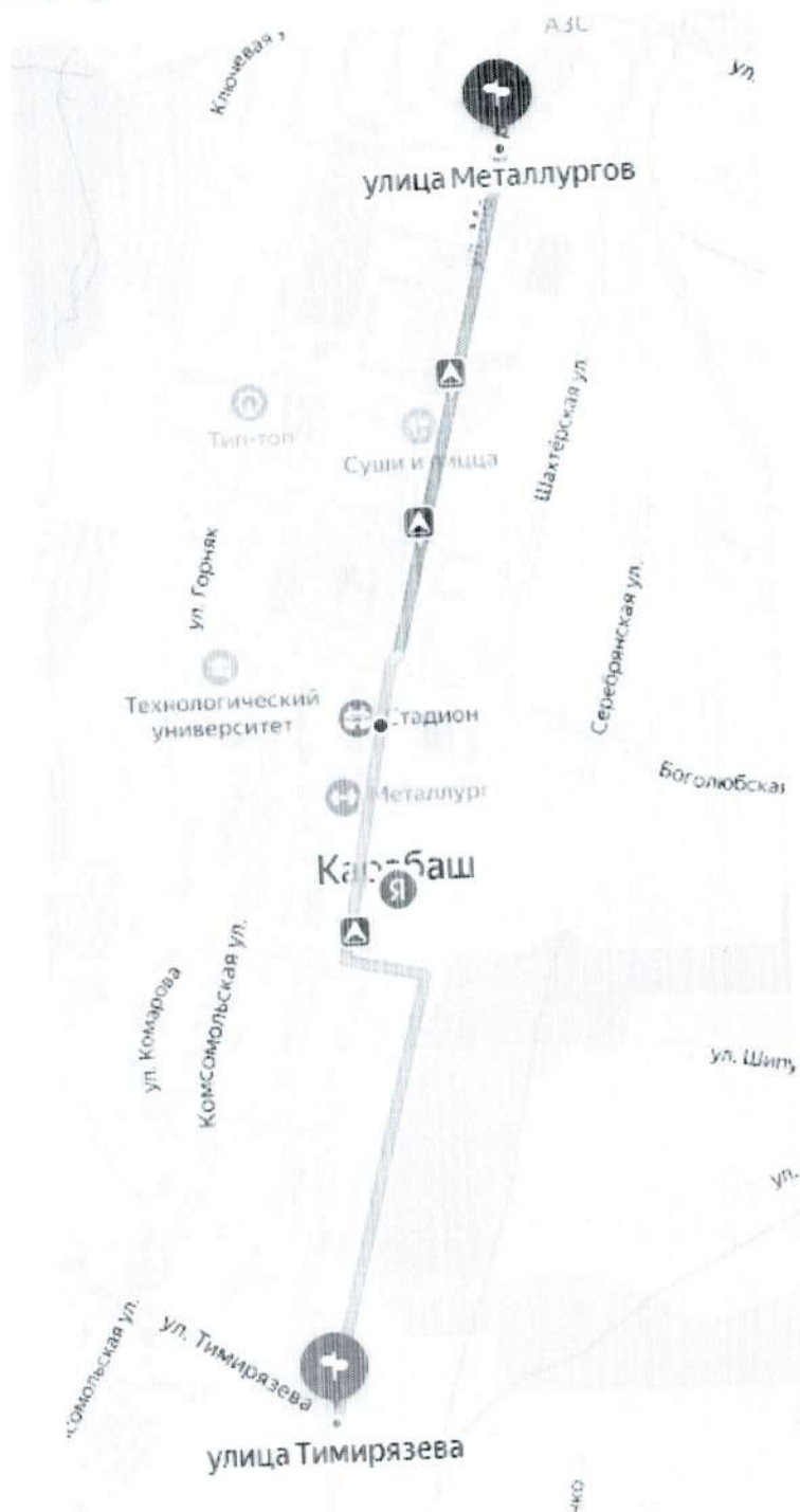
Схема маршрута легкоатлетического пробега 24.09.2022г.

Приложение 3 Утверждено постановлением администрации Карабашского городского округа от 02.09.2022 № 415