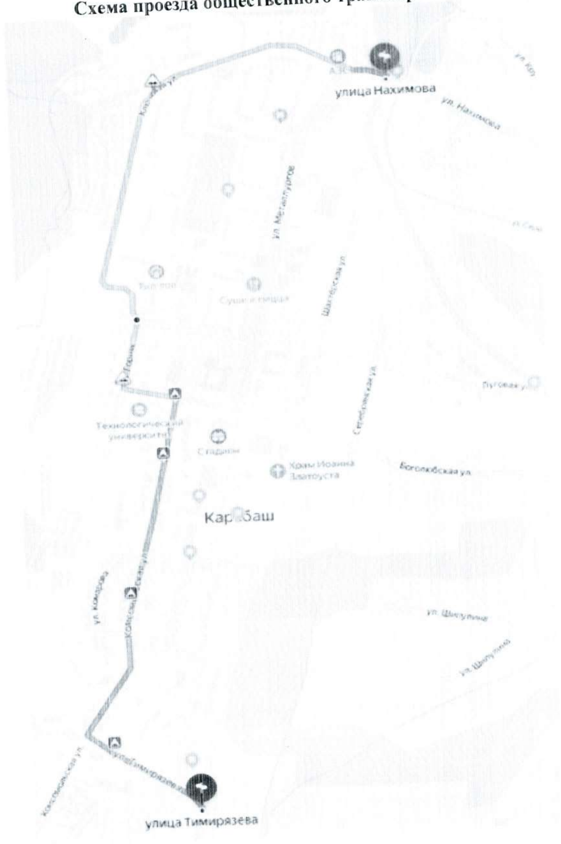
Схема проезда общественного транспорта

Приложение 4 Утверждено постановлением администрации Карабашского городского округа от 08.09.2016 № 445