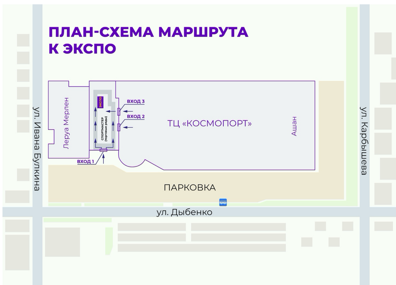
Схема проезда и прохода к ЭКСПО:

11:00 - 20:00 ч. Выдача стартовых пакетов и работа ЭКСПО по адресу: г. Самара, ул Дыбенко 30, ТЦ "Космопорт", магазин Спортмастер, 1 этаж