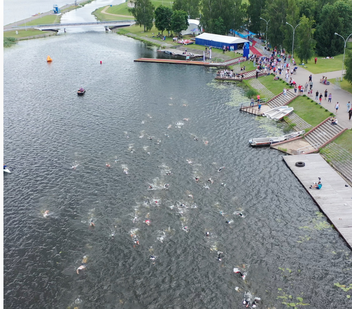
Гребной канал в Заславле

Температура воды в это время года составляет 22-23 градуса, поэтому можно предположить, что гидрокостюмы будут разрешены