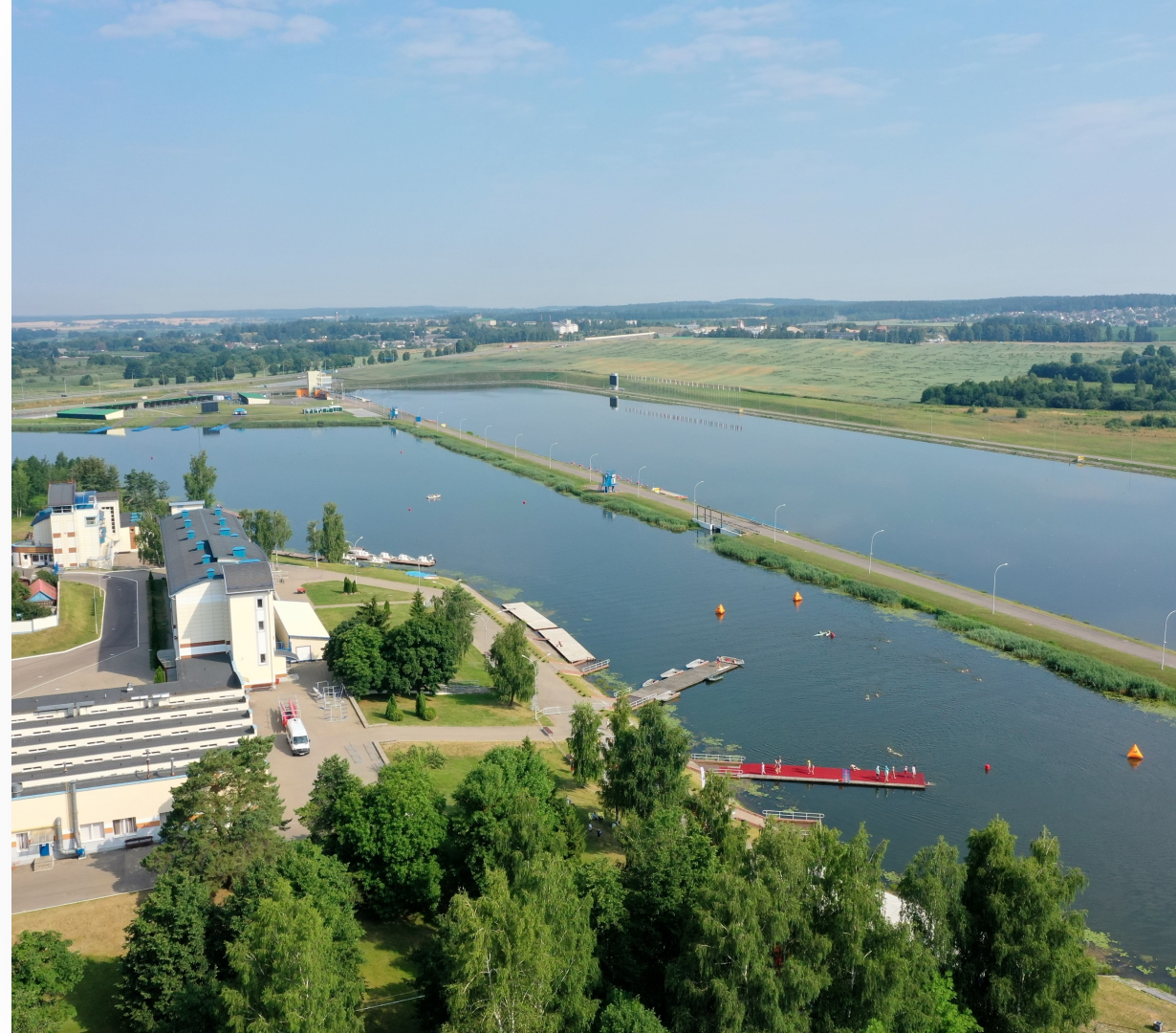
Гребной канал в Заславле

Фан зона / транзитная зона / пройдут плавательный и беговой этапы