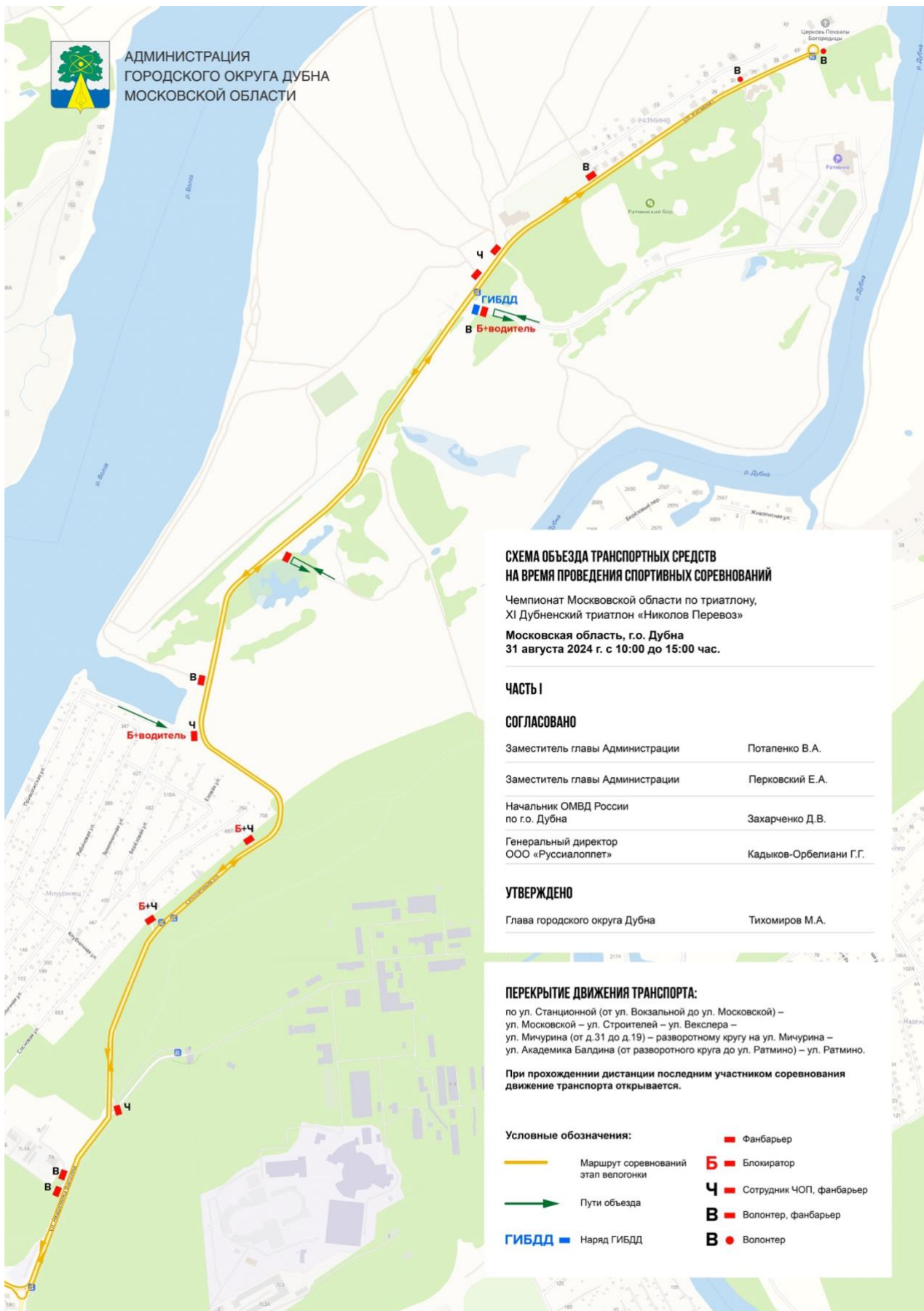
СХЕМА ОБЪЕЗДА ТРАНСПОРТНЫХ СРЕДСТВ НА ВРЕМЯ ПРОВЕДЕНИЯ СПОРТИВНЫХ СОРЕВНОВАНИЙ

АДМИНИСТРАЦИЯ ГОРОДСКОГО ОКРУГА ДУБНА МОСКОВСКОЙ ОБЛАСТИ