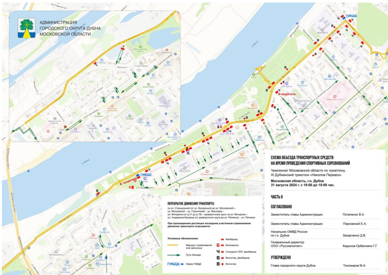
Схема объезда транспортных средств и организации дорожного движения на время проведения спортивных соревнований