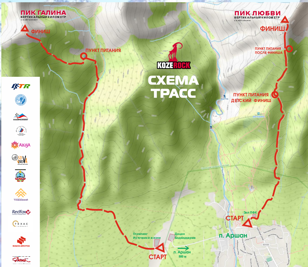
Схема трасс Фестиваля скайраннинга КОЗЕРОГ 2025